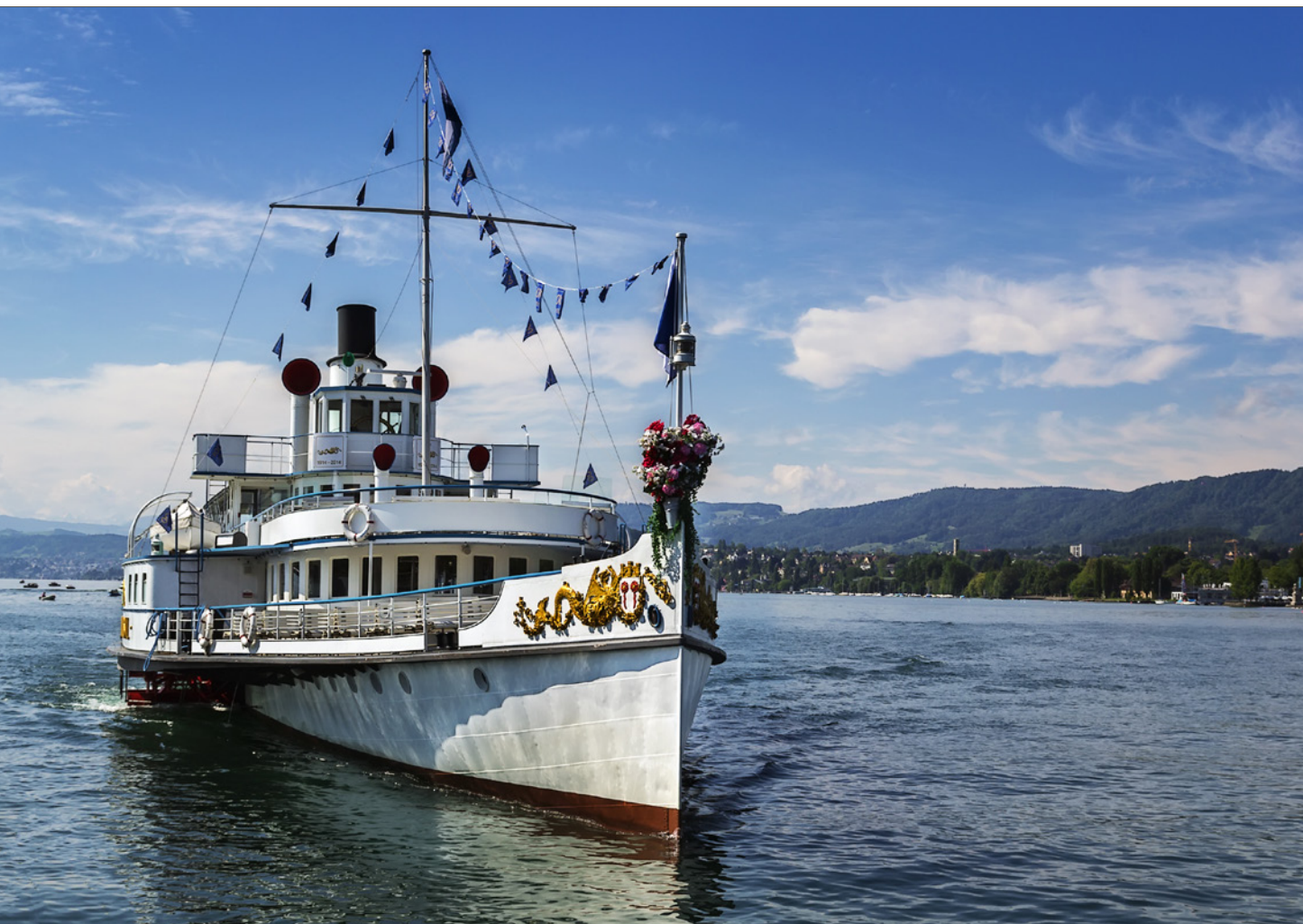
Bateau à vapeur «Stadt Rapperswil», lac de Zurich