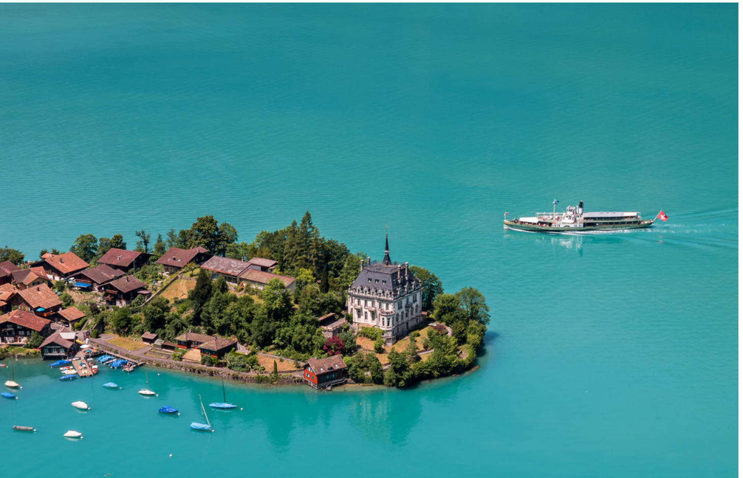
Bateau à vapeur «Lötschberg», lac de Brienz