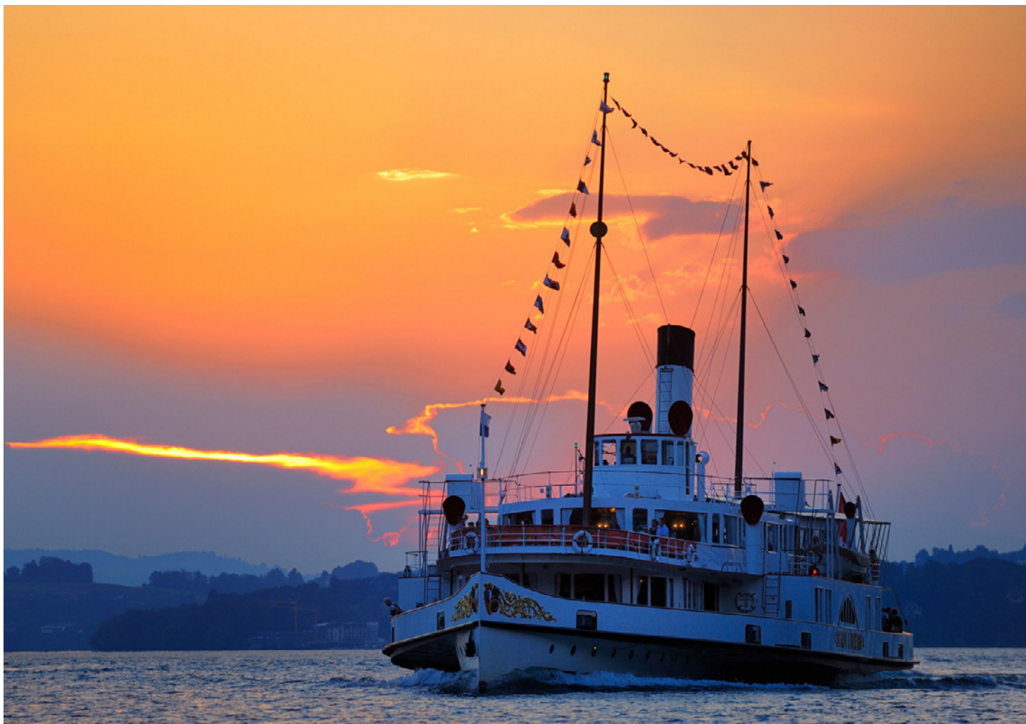
Bateau à vapeur «Stadt Luzern», lac des Quatre-Cantons

En 2022, la commission d'experts s'est réunie trois fois. Une séance s'est tenue virtuellement et deux ont eu lieu sur place, à Berne et à Zurich.