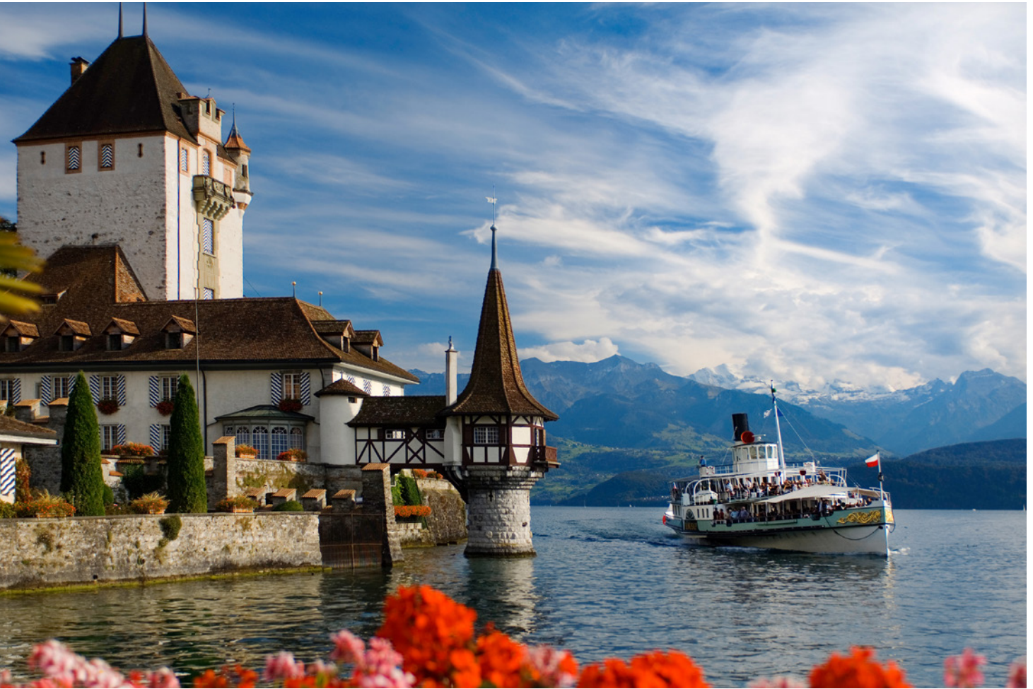
Bateau à vapeur «Blümlisalp», lac de Thoune