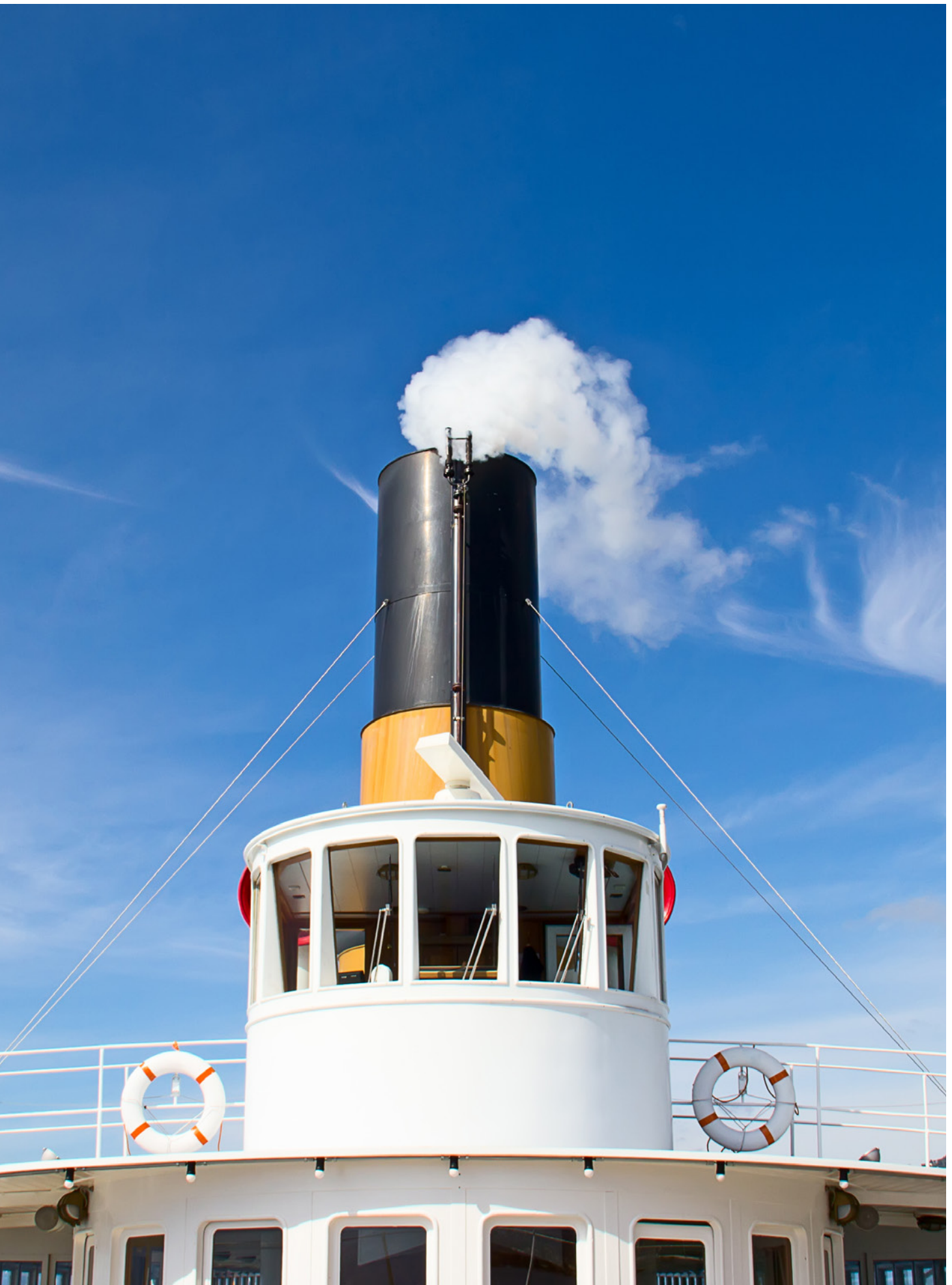
Bateau à aubes «Rhône», lac Léman