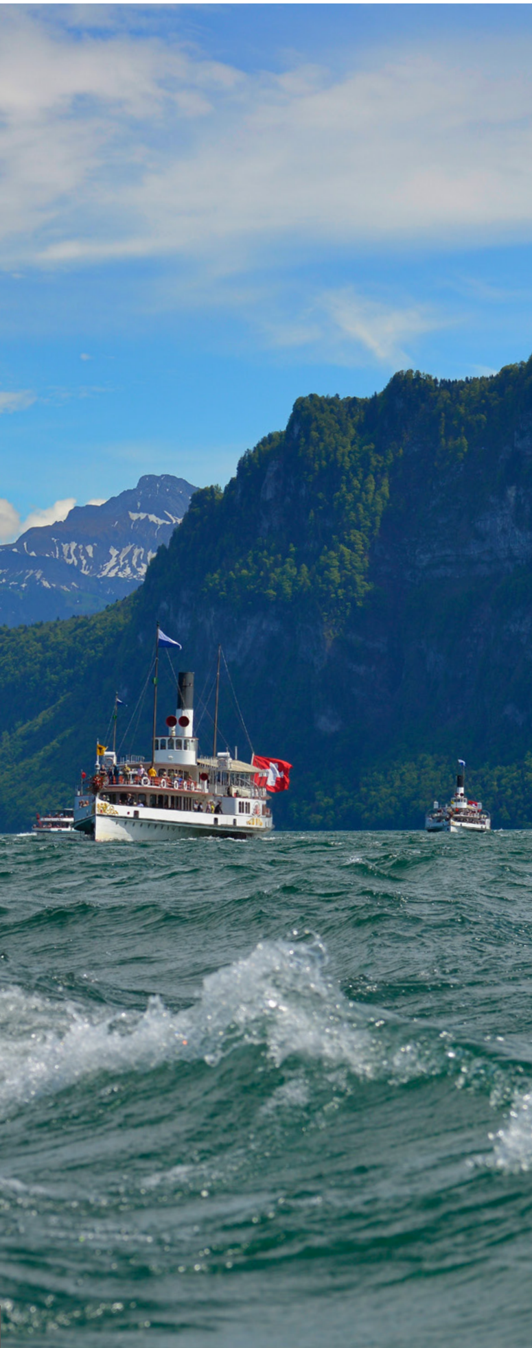
Parade de la flotte, lac des Quatre-Cantons