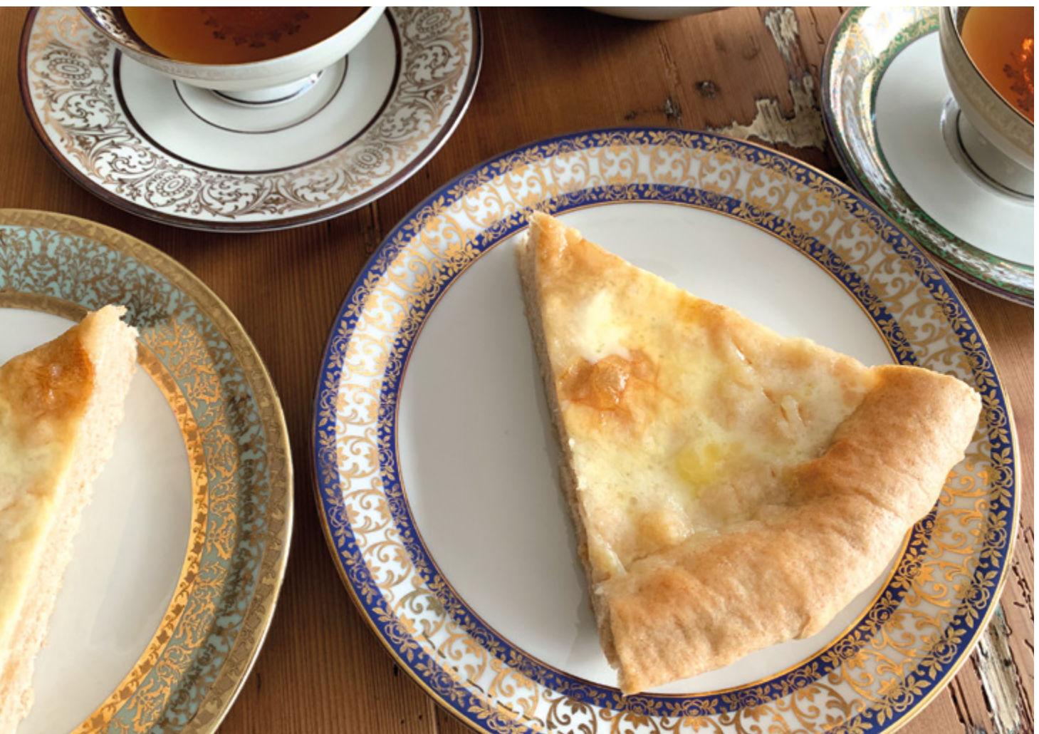
Nidelkuchen «Gâteau du Vully», Fribourg