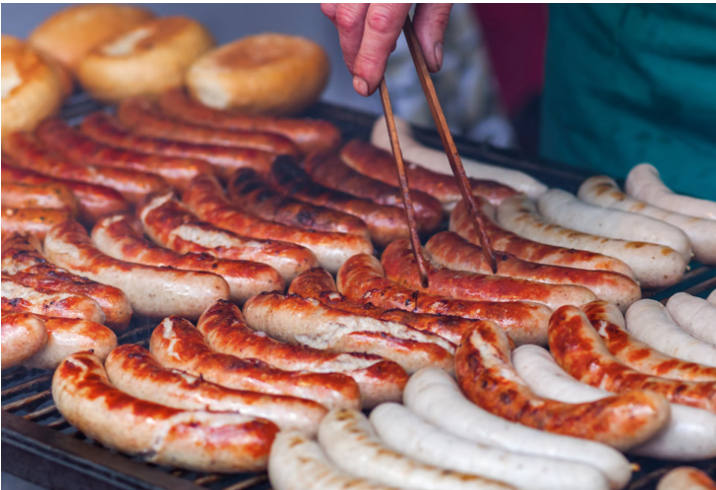
Saucisse de veau Olma, Saint-Gall