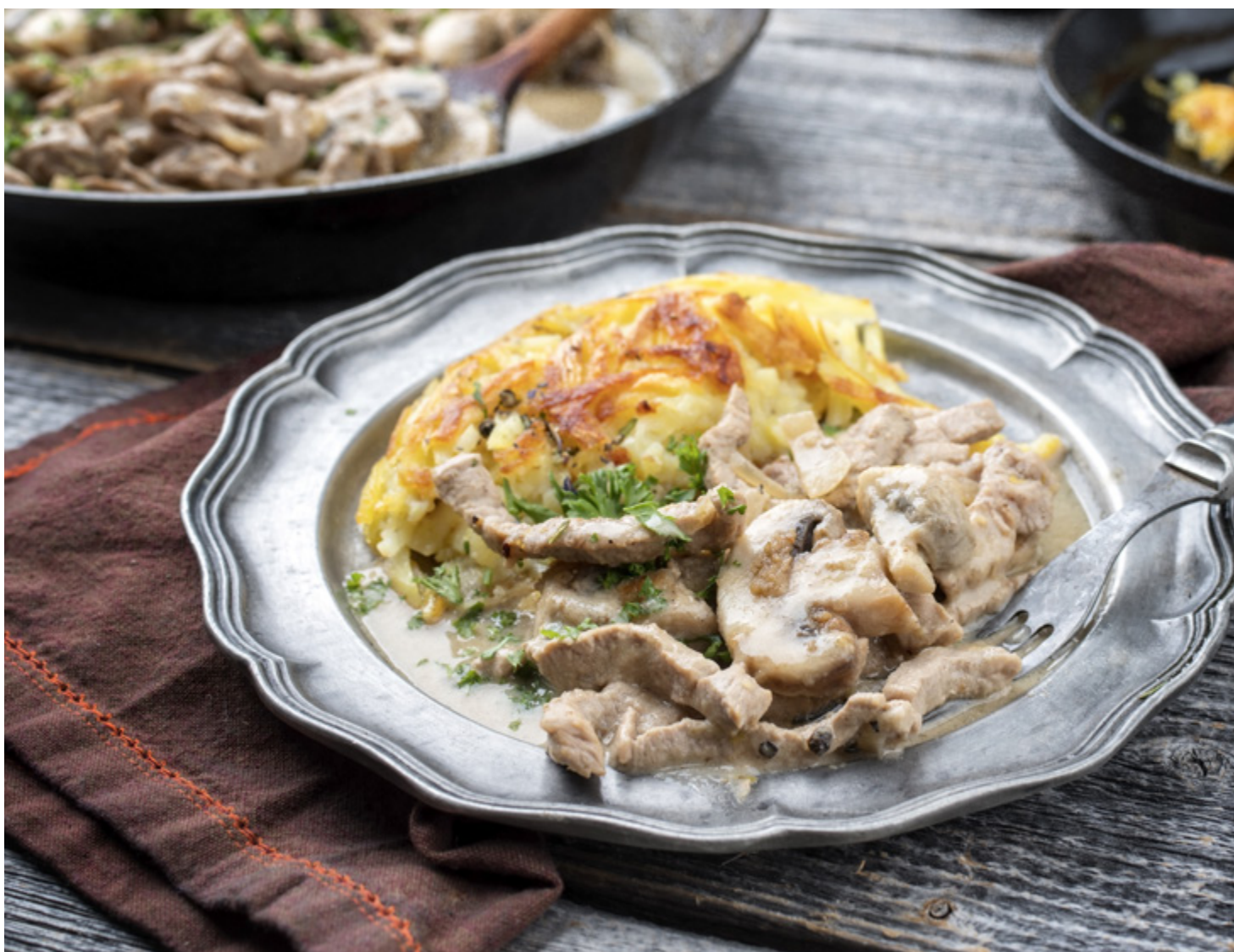
Émincé de veau à la zurichoise