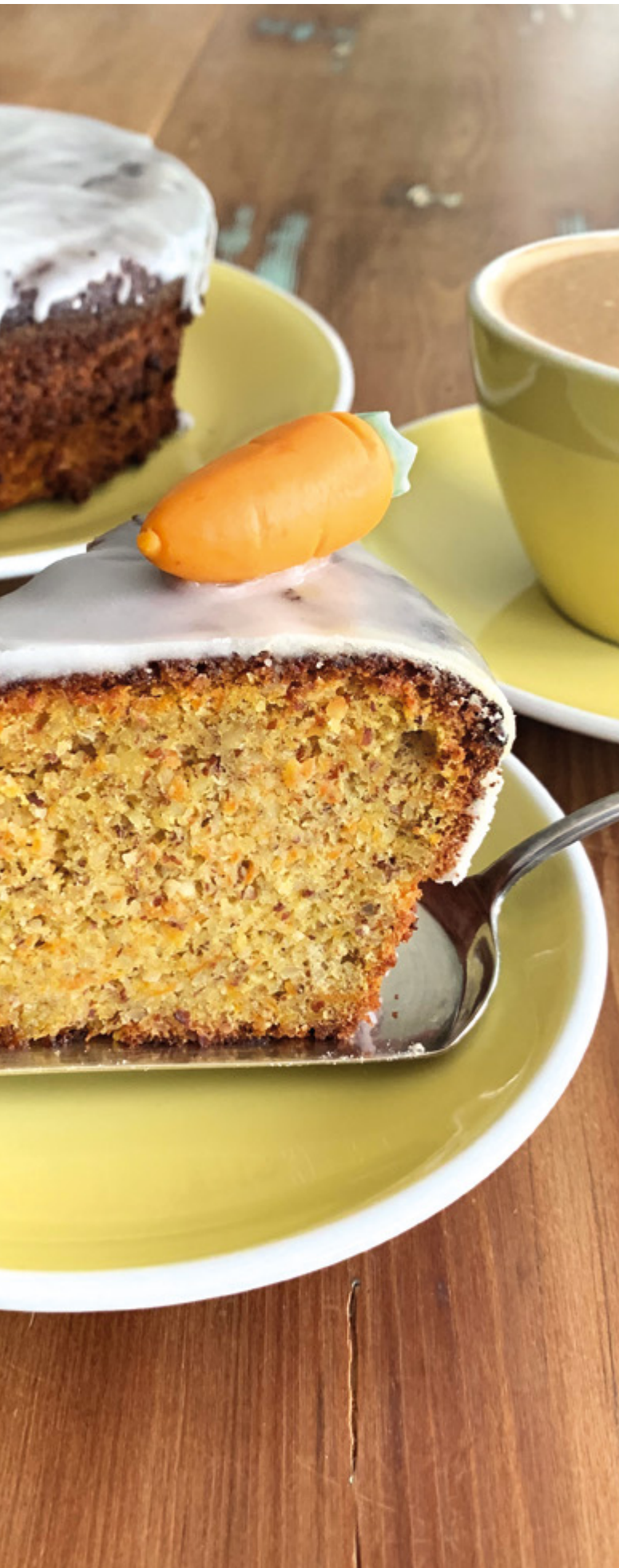
Gâteau aux carottes d'Argovie