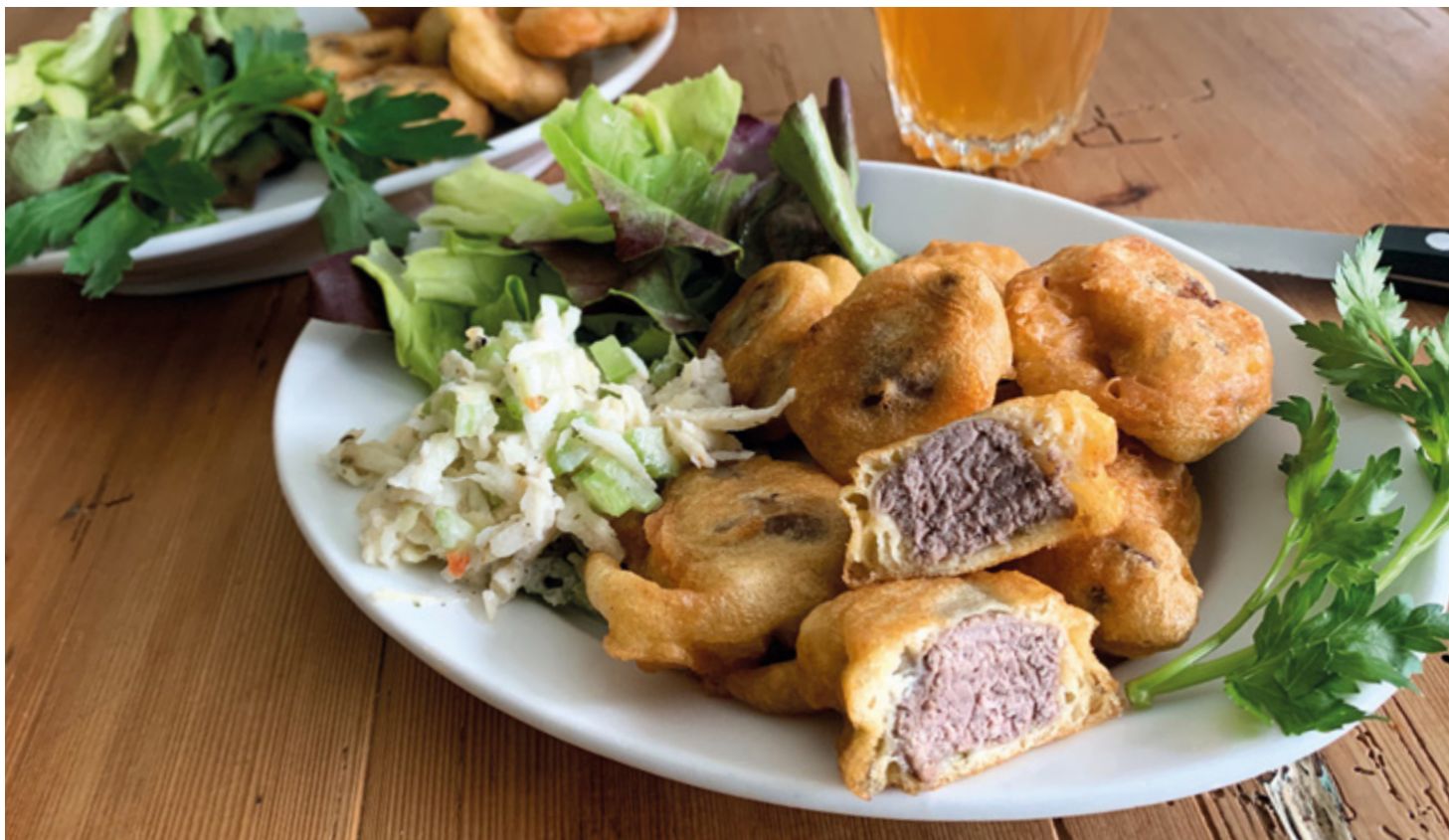
Gitzi Chüechli appenzellois