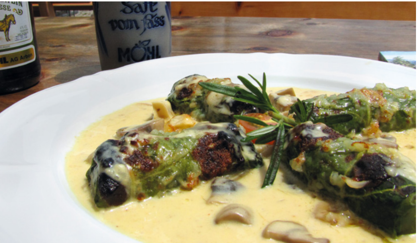
Capuns des Grisons