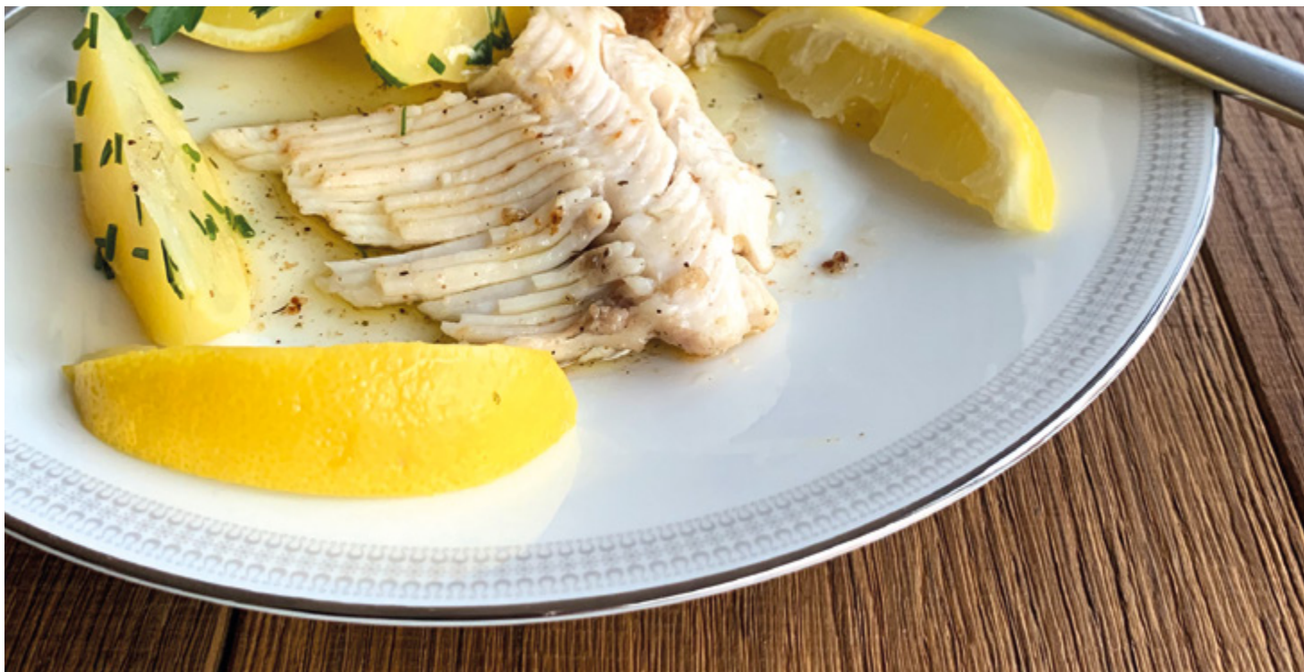
Truite du Léman pochée