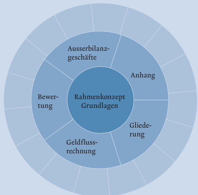
Swiss GAAP FER für mittlere Organisationen