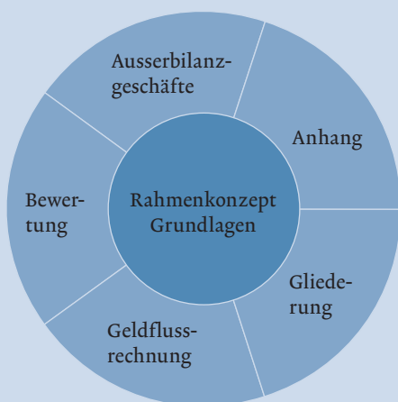
Rahmenkonzept inkl. Kern-FER für kleine Organisationen